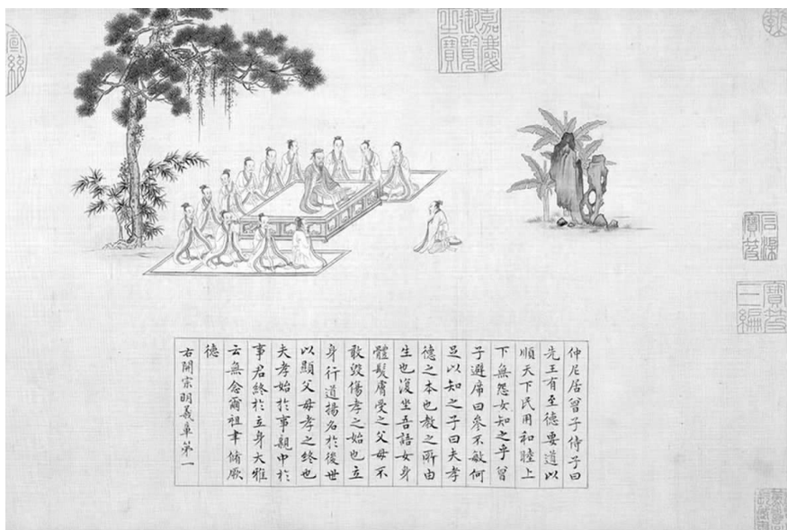
明代 仇英·文徵明《孝经图》