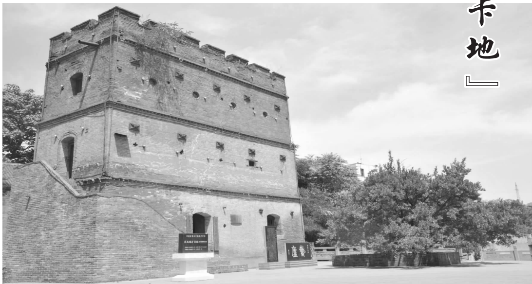
观音堂煤业矿区内的百年古炮楼