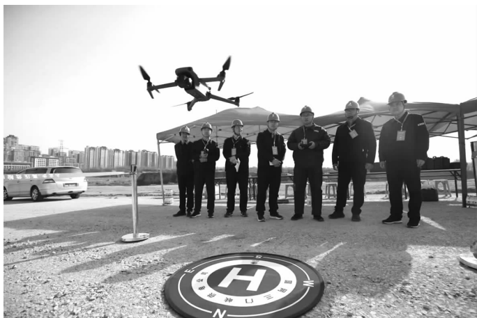
4月1日至2日,由三门峡市总工会主办,国网三门峡供电公司承办的“智巡电网 竞展锋芒”三门峡供电系统无人机精益化巡检劳动竞赛在三门峡职工之家举办。