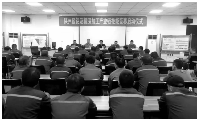
5月21日,陕州区铝及精深加工产业链专项技能竞赛启动仪式在恒康铝业举行。来自恒康铝业和戴卡轮毂的80余名参赛选手参与。