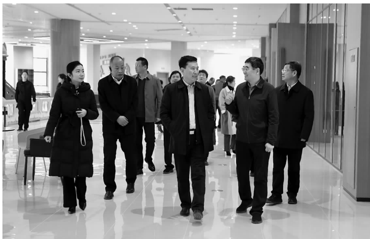
漯河市总工会调研三门峡职工之家。

三门峡市劳模工匠宣讲工作培训班在三门峡职工之家举办。各县(市、区)工会、市属机关工会和市属各系统、各基层工会的劳模工匠代表、宣讲骨干、工会宣教干部等 200 余人参加培训。