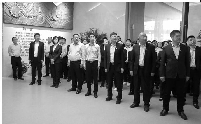
金渠集团、酒店集团参观三门峡职工之家。