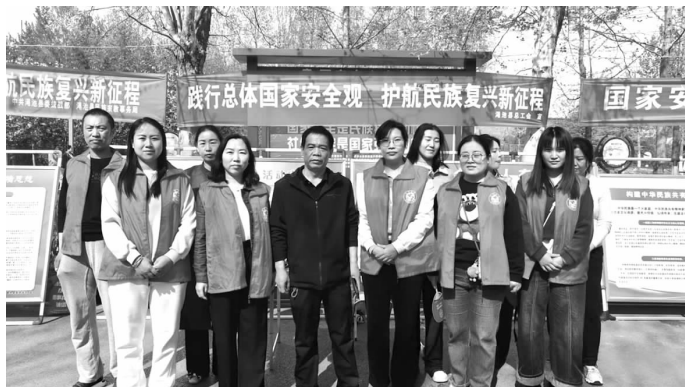
为切实推动国家安全理念深入人心,渑池县总工会日前组织干部职工在涧河生态公园参加全县举办的“国家安全教育”主题宣传活动,向广大群众详细讲解《国家安全法》等法律法规,普及国家安全基本知识。